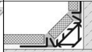
COVESTAR mit Fliese

Profil für dekorative Einsatzzwecke bei besonders hohen Anforderungen an Hygiene, Technik, Ästhetik und Perfektion.