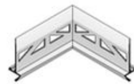
Angle intérieur vertical