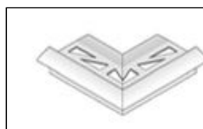
Angle extérieur horizontal