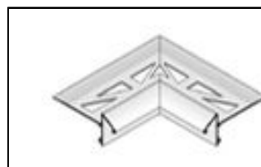
Angle intérieur horizontal