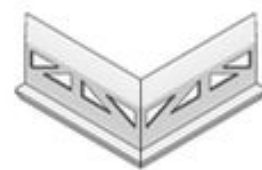
Angle extérieur vertical