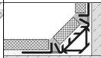
COVESTAR mit Fliese

Profil für dekorative Einsatzzwecke bei besonders hohen Anforderungen an Hygiene, Technik, Ästhetik und Perfektion.