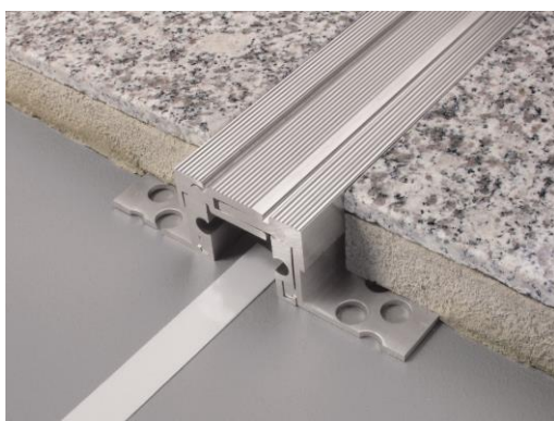
Dural_ "Duraflex SE" in alluminio per fugature di separazione edifici e applicazioni a carichi pesanti._05