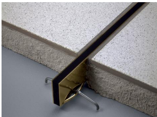
Dural_ "Duraflex TL" in versione di ottone con ancore di fissaggio per una posa in procedura a giunto spesso e per le elevate sollecitazioni._04