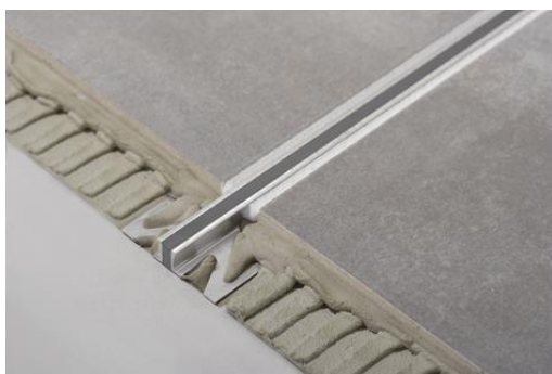
Dural_ "Duraflex DFA" per la posa nella procedura a giunto sottile per rivestimenti di piastrelle e pietra naturale._03