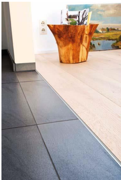
Dural_ Duraflex" per il passaggio elegante: I profili collegano i rivestimenti in piastrelle con superfici di collegamento, con pareti, intelaiature di porte e porte-finestre._01