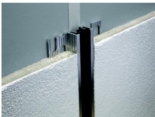
Dural_ "Duraflex KC" in acciaio zincato e con inserto in gomma nitrilica per fugature di pareti._06