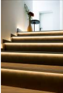
Leuchtendes Beispiel für moderne Stufengestaltung: „Florentostep“ von DURAL sorgt für angenehmes Licht, für Kantenschutz und Sicherheit.