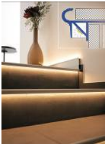
Indirekte Stufenbeleuchtung mit den neuen „Florentostep LED“ von DURAL. Der Querschnitt rechts oben veranschaulicht den stabilen, ganzheitlichen Aufbau der Profile.